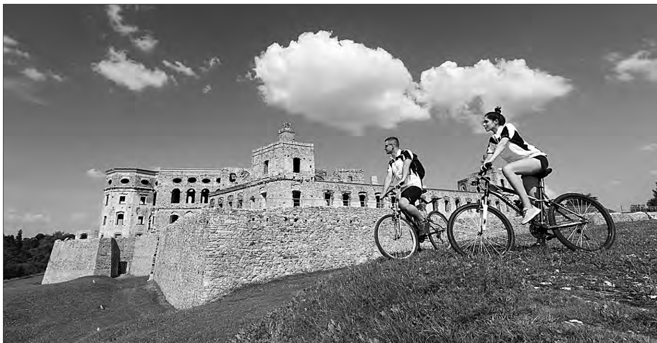
На маршруті Green Velo на мандрівників чекає багато відкриттів і вражень.

Винятковість регіонів, через які пролягає маршрут, підкреслюють туристичні атракції — і ті, що розташовані безпосередньо біля велотраси, і ті, що в межах 20-кіломет-