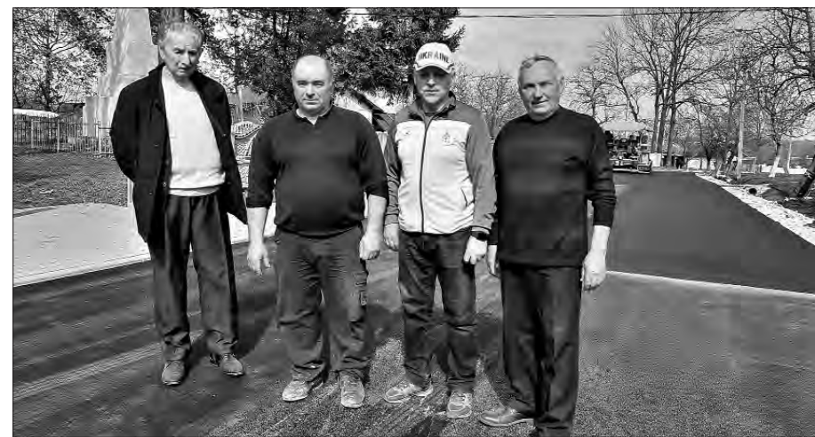
Частину коштів — на асфальтування вулиці Ярослава Палійчука.

тється. Влучив у шойно облаштовані наші окопи. На щастя, ми вчасно почули звук дрона та пішли звідти. А тут із нашого боку злетіла ракета — і в той дрон! Що тут скажеш — війна...».