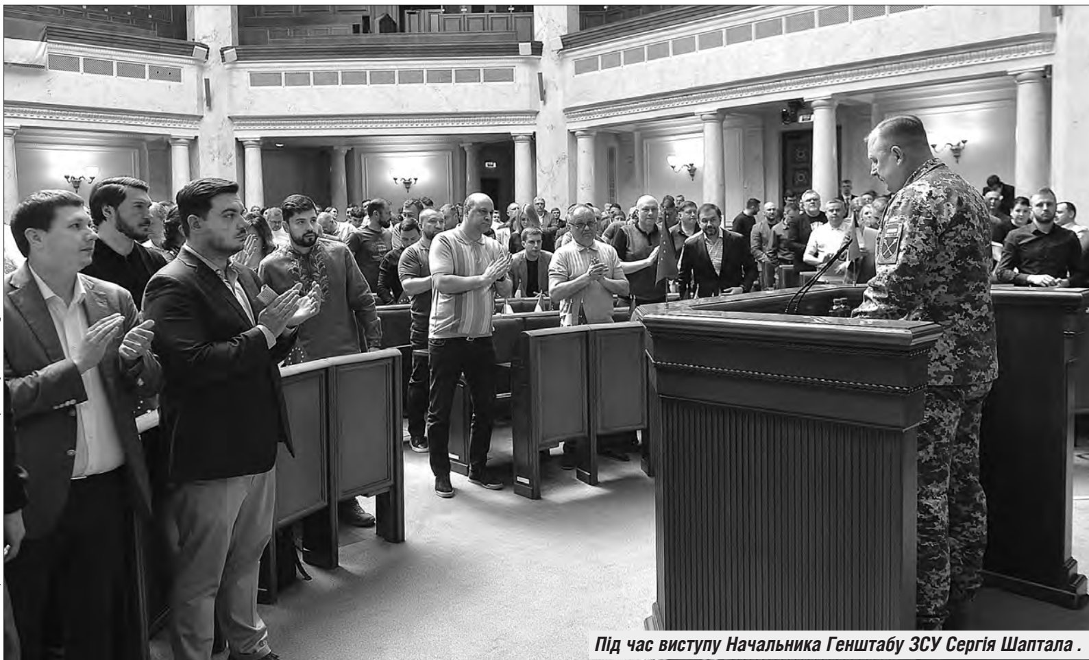
Більше фото тут — www.golos.com.ua